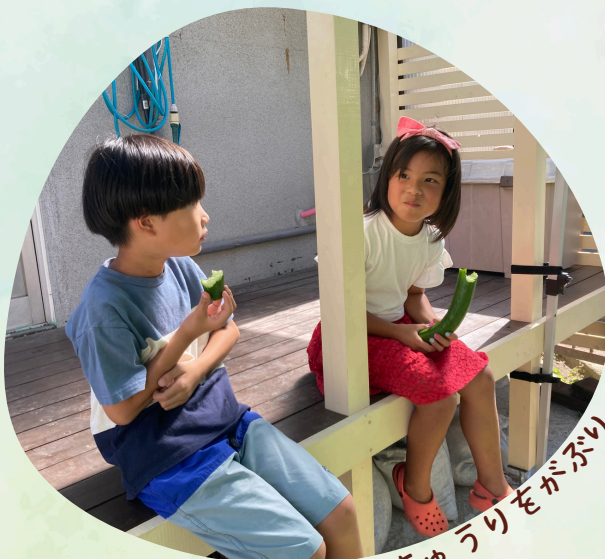
庭で採れたきゅうりをがぶり